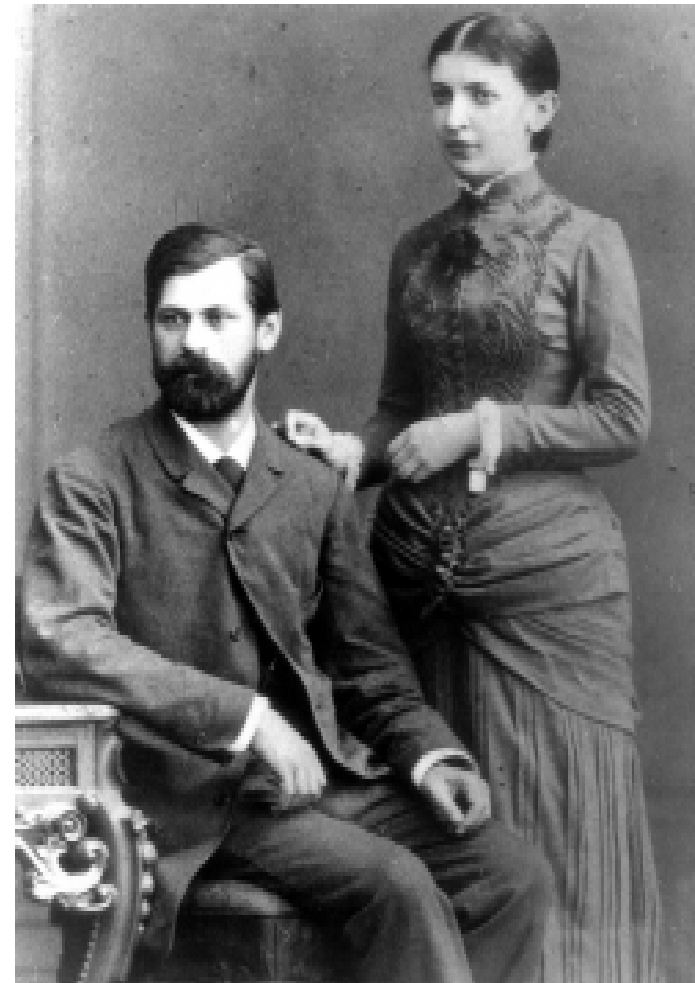
Зигмунд Фрейд с женой

Нужно отметить, что ни частная практика, ни работа в больнице не принесли Фрейду материального благополучия, о котором мечтал молодой врач. В это же время Фрейд знакомится со своей будущей женой Мартой Бернайс, которая принадлежала к гораздо более обеспеченным и более высоким кругам венской интеллигенции. Отчасти именно последние обстоятельства «способствовали» тому, что период ухаживания затянулся на многие годы. Любовь еще больше усилила свойственное многим незаурядным личностям стремление к признанию и материальной независимости. В одном из писем невесте, отправленном перед отъездом в Париж, это стремление выражено Фрейдом предельно откровенно и даже с некоторым юношеским максимализмом. Он писал ей, что обязательно станет великим ученым, вернется в Вену в ореоле славы, вылечит всех безнадежных больных и они поженятся. Как известно, влюбленные часто обещают больше, чем могут, но далеко не всегда выполняют даже возможное. К чести Фрейда, большая часть обещаний им была выполнена, и лишь в отношении безнадежных больных и через сто лет у нас все еще не так много поводов для оптимизма.