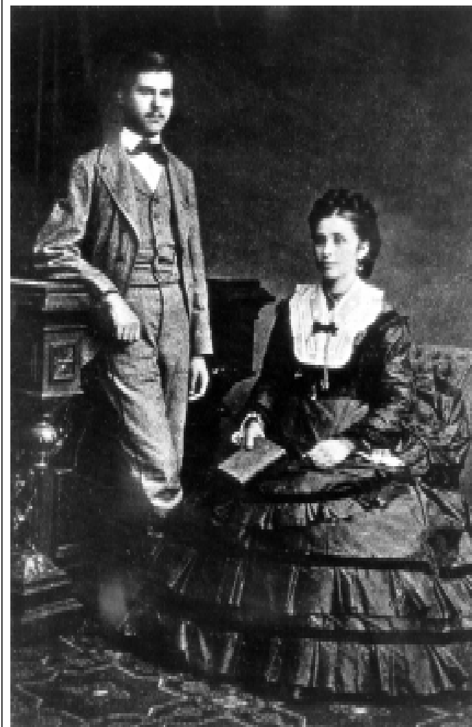
Зигмунд Фрейд с матерью

(1838–1917), развивавшего идеи об интенциональности (предметности) сознания как одном из главных признаков всех психических феноменов. Уместно отметить, что лекции Ф. Brentano, который, прежде чем увлечься философией, был католическим священником, уже содержали идею о психическом и психических актах, как самостоятельном разделе знаний, хотя психология человека еще не выделялась в отдельное направление. Идеи Ф. Brentano в последующем развил Э. Гуссерль (1859–1938) — один из основателей учения о феноменологии, из которой затем появился экзистенциализм, базирующийся на идее целостности человеческого существования как субъекта и объекта одновременно. Здесь уместно сделать одно очень важное примечание: согласно взглядам одного из видных представителей этого направления Карла Яспера (1883–1969), большинство психических страданий представляют собой «специфическую форму существования в мире», при этом подразумевается, что мир психиатрического пациента просто более индивидуален, то есть гораздо больше отличается от того усредненного восприятия всего окружающего, которое объединяет большинство людей. В равной степени это относится и к индивидуальным способам адаптации к реальности, которые могут восприниматься окружающими как патологические, но, по сути, также представляют собой «специфическую форму существования в мире». Я попробую