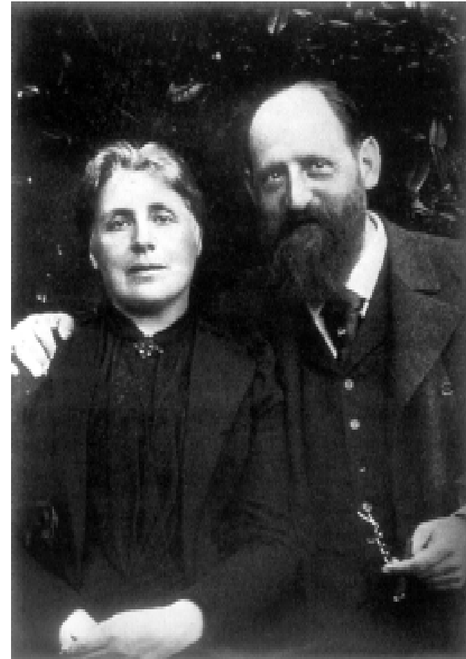
Йозеф Брейер с женой

Изучением истерии на протяжении ряда лет Фрейд занимался совместно со своим старшим коллегой и наставником — невропатологом, психиатром и психологом Йозефом Брейером (1842—1925), который также сыграл огромную роль в жизни и научных исследованиях Фрейда. Некоторое время Фрейд учился у Брейера (который был старше на 14 лет и уже имел солидную врачебную репутацию) технике гипнотизации. Затем Фрейд начинает самостоятельно применять гипноз, но скоро разочаровывается в этом методе. Некоторые