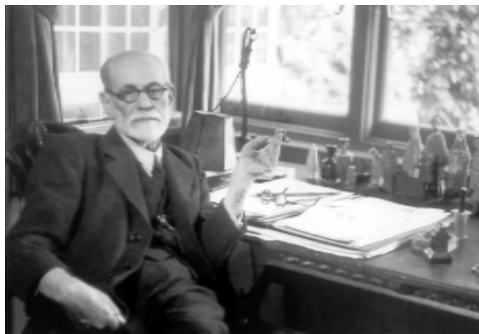
Зигмунд Фрейд в последний год жизни

была рассказана мне сотрудником дома-музея Фрейда в Лондоне: в один из дней у 83-летнего Фрейда случился очередной сердечный приступ, и пока его поднимали из кабинета в спальню на втором этаже, он скончался. По другой — в одну из сентябрьских ночей 1939 года лечащий врач, выполняя последнюю волю Фрейда, прекратил его невыносимые мучения, сделав ему инъекцию большой дозы морфия.