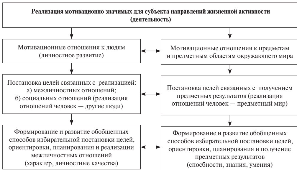
Рис. 2. Мотивационно значимые направления жизненной активности (деятельности)

вых индивидуально-избирательных способов: а) перцептивной, умственной и эмоционально-оценочной ориентировки в межличностных и социальных отношениях; б) постановки целей, требующих организации собственного поведения и поступков в межличностных отношениях и социальных ситуациях; в) активной реализации таких поступков и форм поведения (рис. 2). Личностные качества (черты характера) можно рассматривать как результат формирования особых высших психических функций, которые формируются на основе внешних, разделенных с другими людьми форм общения и взаимодействия, путем преобразования их в индивидуально-психические образования. В связи с этим знаменитый тезис Л. С. Выготского может быть перефразирован: завтра ребенок будет самостоятельно поступать так («зона ближайшего развития» личности), как сегодня он поступает вместе с взрослыми («зона актуального развития»).