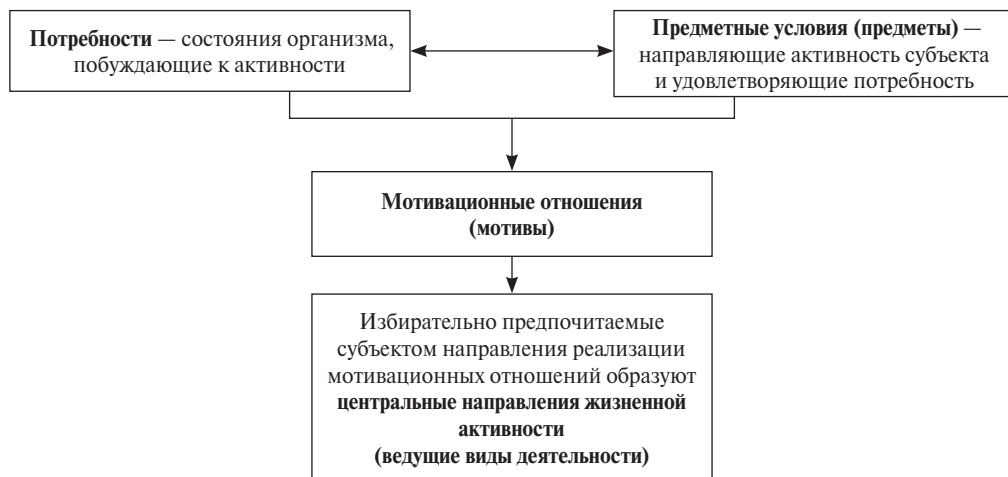
Рис. 1. Формирование направлений жизненной активности субъекта

ствуются в направлении от выделения свойств окружающей среды к выделению объектов (восприятие и опознание), и к установлению отношений и связей между объектами и свойствами объектов (мышление) (Леонтьев, 1965; 2012).